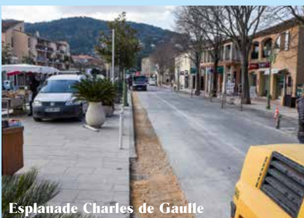
Esplanade Charles de Gaulle