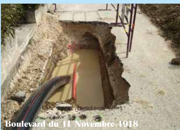
Boulevard du 11 Novembre 1918