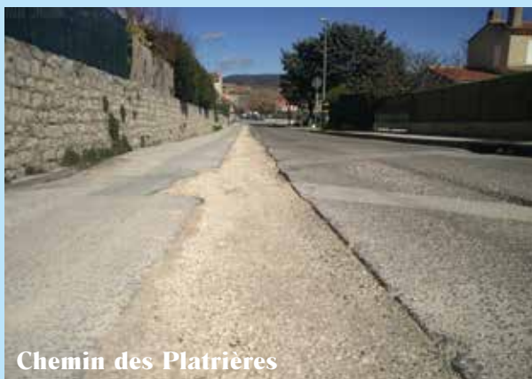
Chemin des Platrières