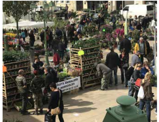
> Printemps des Jardiniers