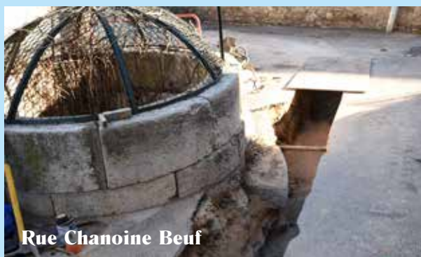
Rue Chanoine Beuf