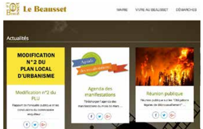
> Un nouveau site internet pour la commune