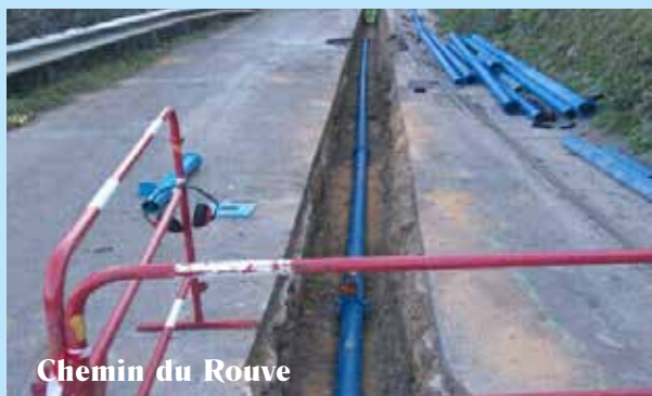
Chemin du Rouve