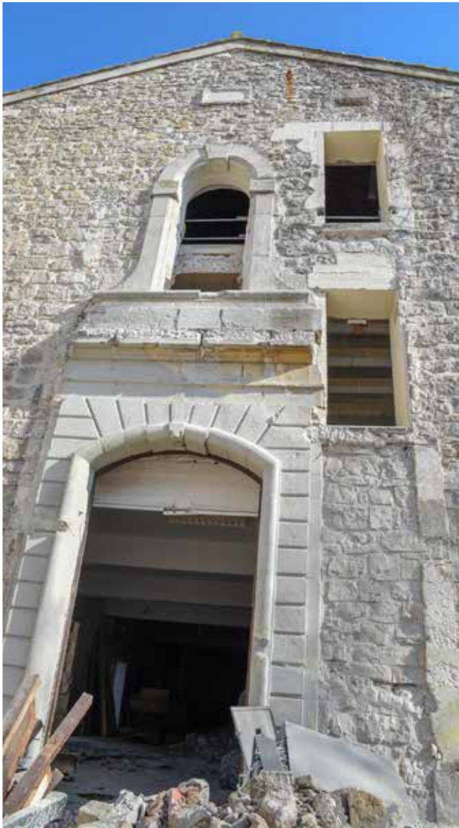
> Travaux : Maison des Arts